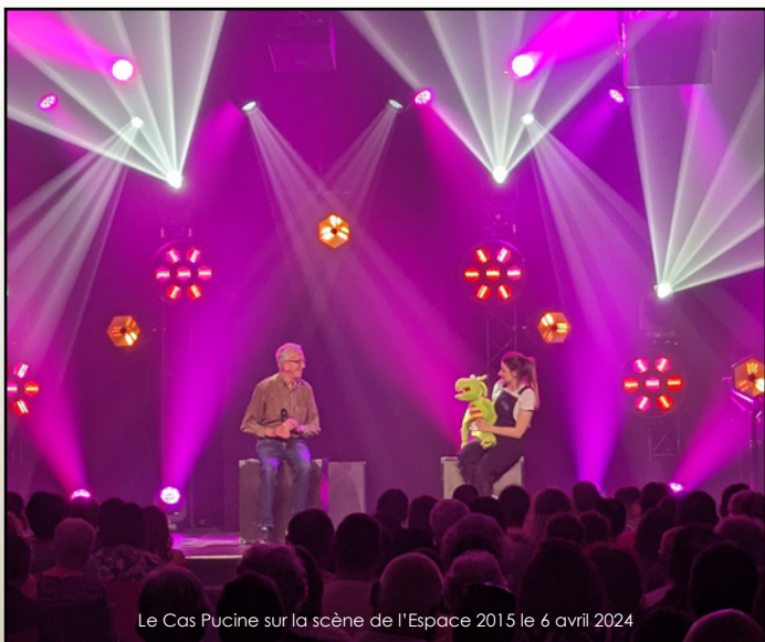
Le Cas Pucine sur la scène de l'Espace 2015 le 6 avril 2024

+33 5 59 05 32 15 / contact@espace2015.com