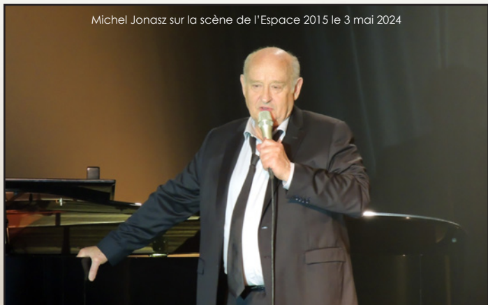
Michel Jonasz sur la scène de l'Espace 2015 le 3 mai 2024